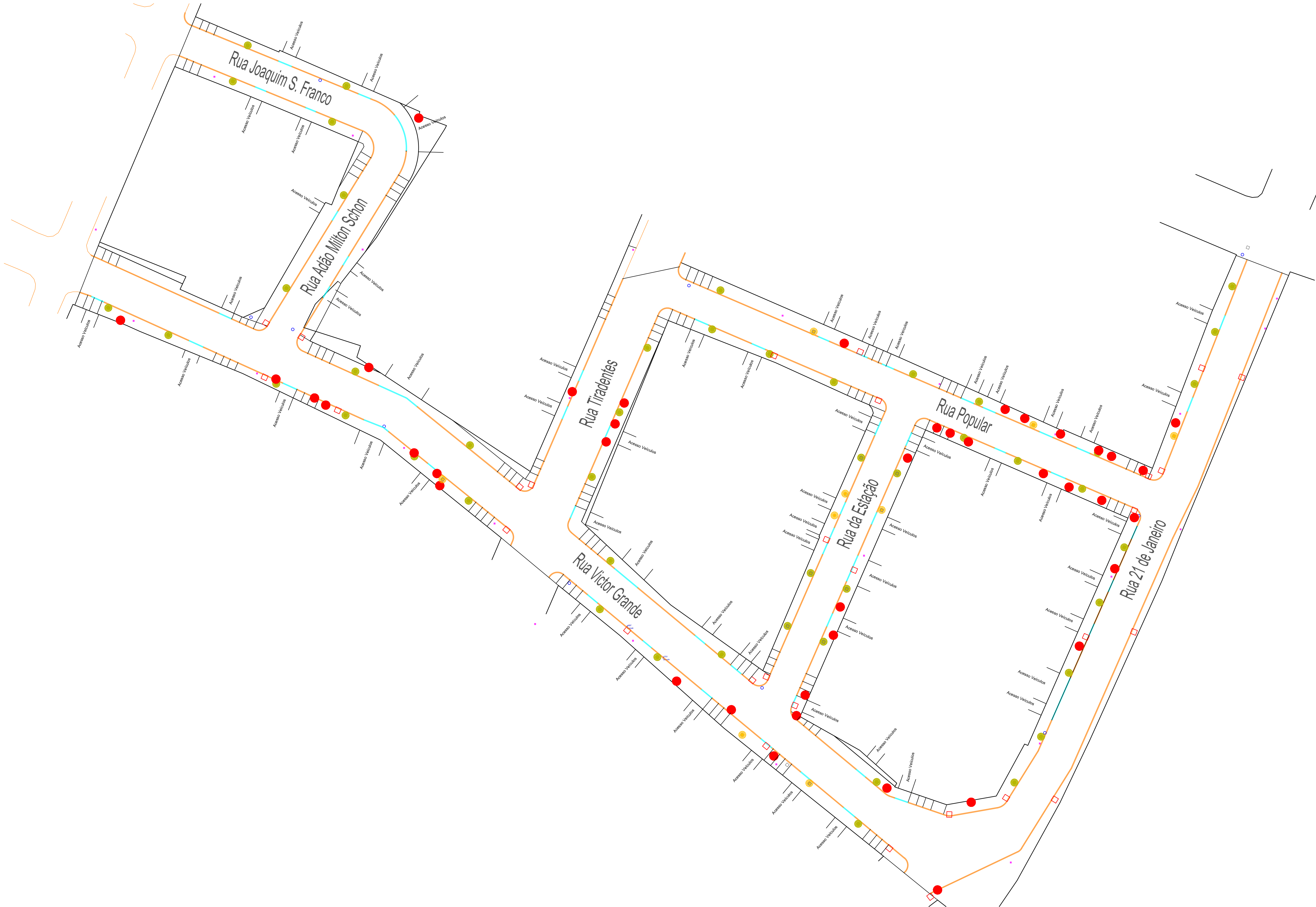
PLANTA DE PAISAGISMO Escala 1:500